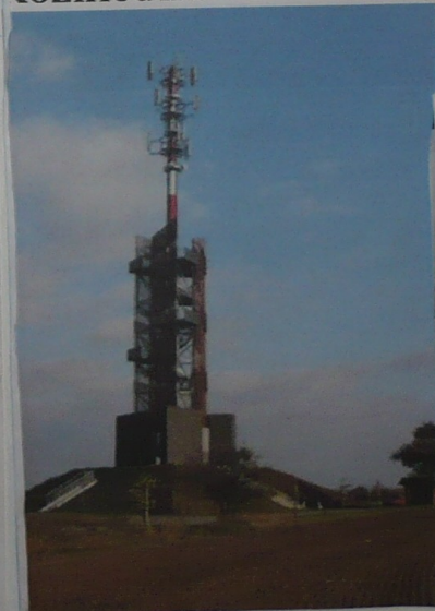
pohled na obec z rozhledny