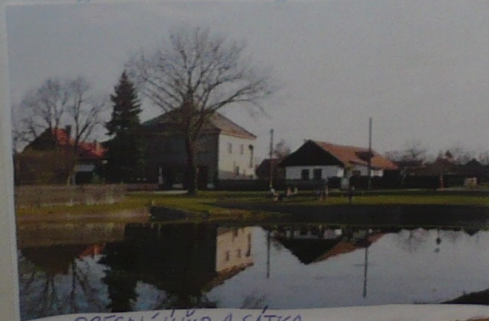
OBECNÍ ÚŘAD A SÁTKA